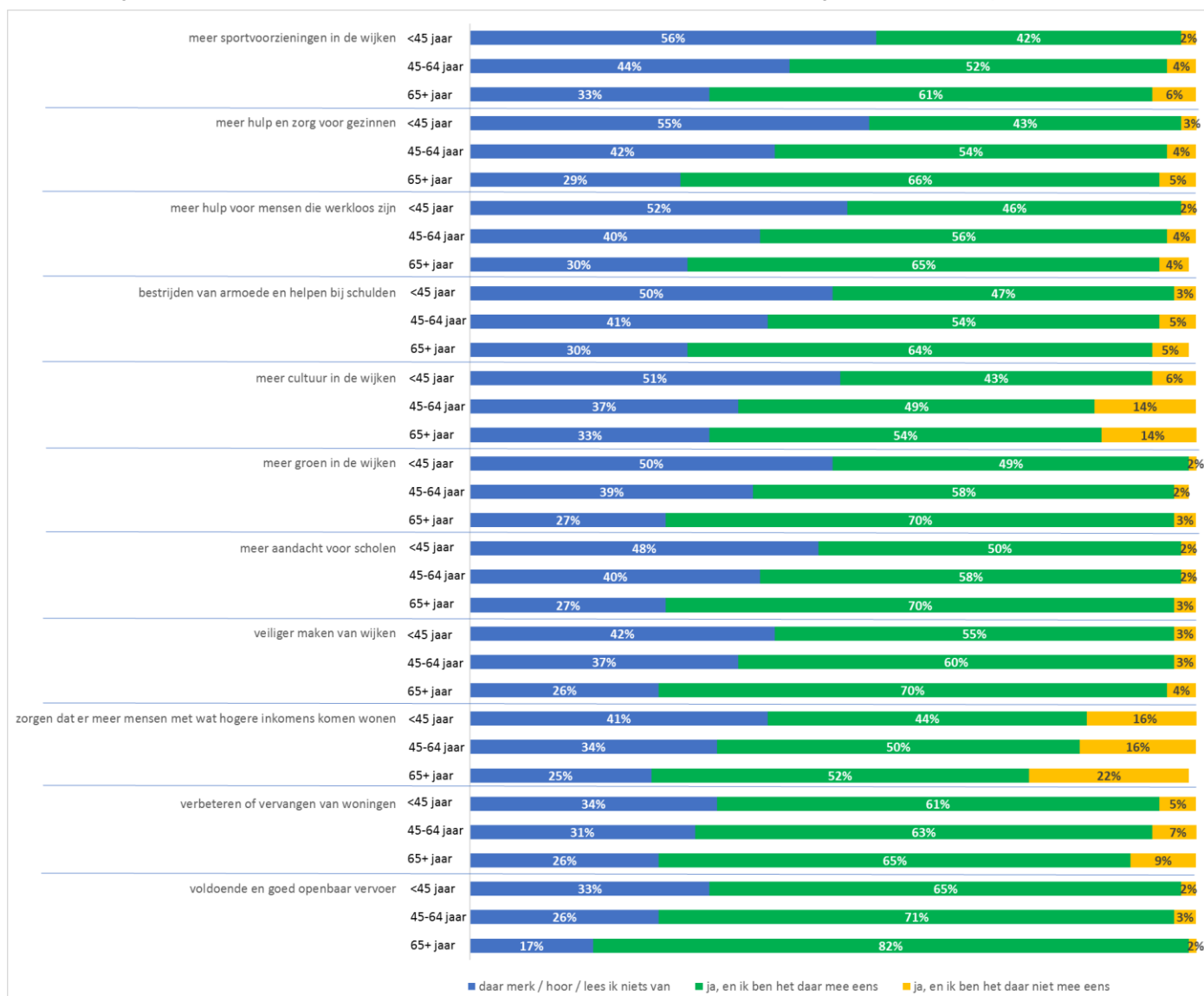
Figuur 3: Waar merken Rotterdammers wat van? En wat vindt men ervan? Uitgesplitst naar leeftijd.